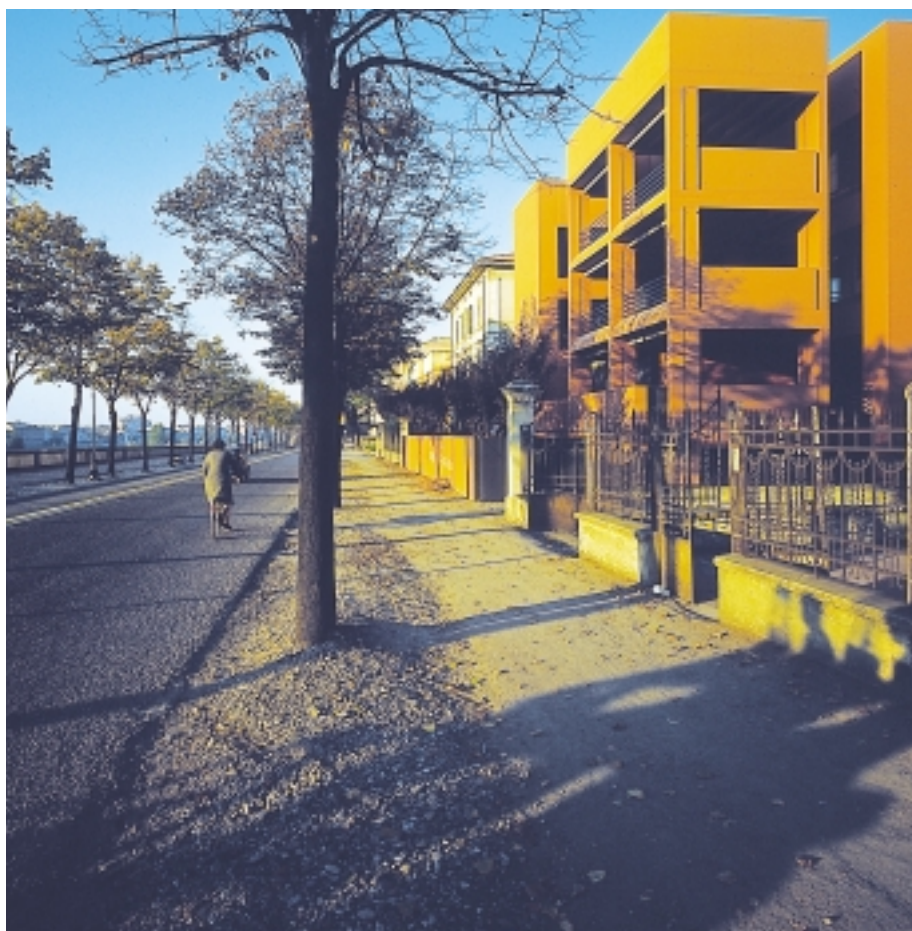
Casa in viale Basetti a Parma. Scorcio del fronte principale sul LungoParma.