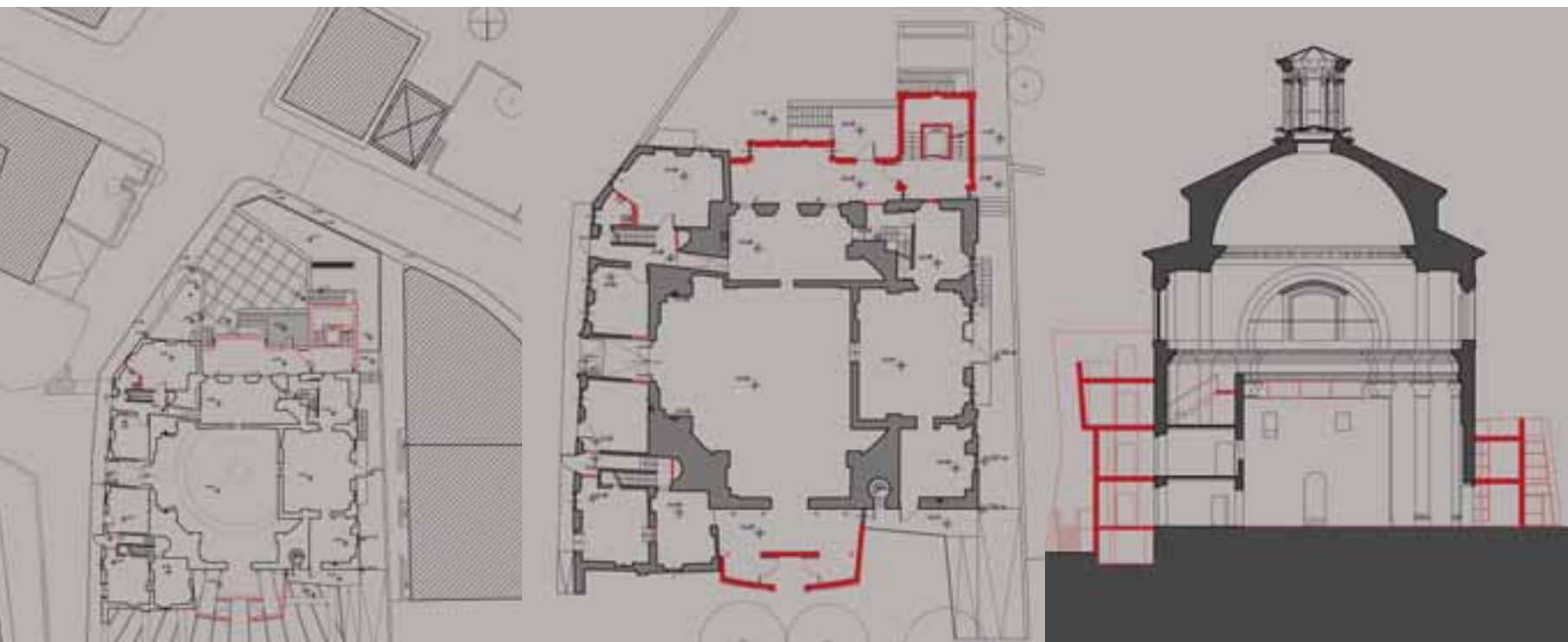
Planimetria dell'insieme, pianta piano terra e sezione (con le addizioni in rosso).