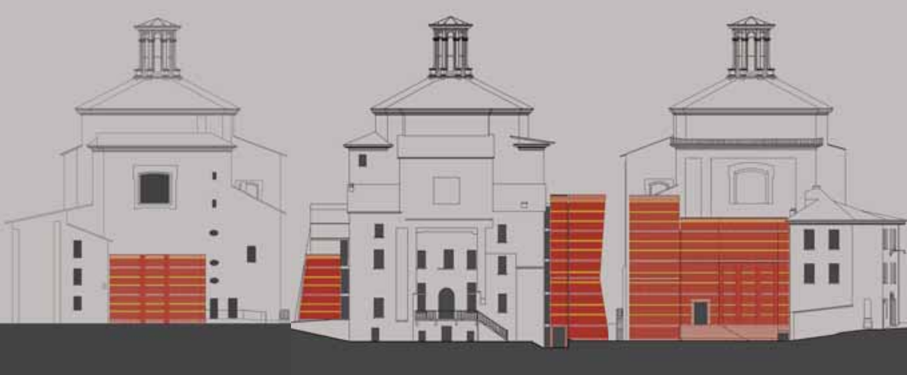
I tre prospetti (nord, ovest e sud).