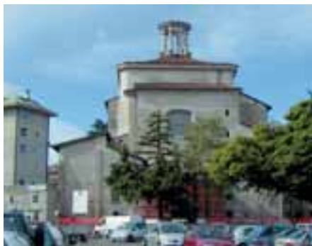
Facciata della chiesa di S. Ambrogio a Cantù con l'addizione sulla piazza (nascosta dagli alberi).