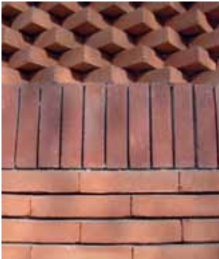
Particolare del paramento in mattoni dell'addizione.

Nella pagina a fianco: l'ampliamento verso sud.