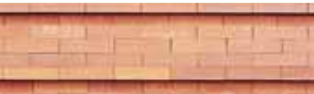
FOTOGRAFIE Alfonso Acocella

È quanto sembrano comunicare le opere che vengono presentate in questo numero della rivista le quali, più che creare nuove ed inedite soluzioni, aggiornano, traspongono, riducono, compongono, colorano “facsimili” di texture già scritte - in qualche modo - dalla Storia.