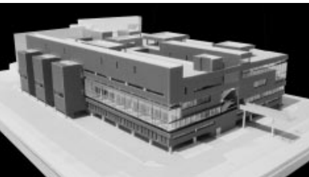
Plastico di studio.

Nella pagina a fianco: fronti sud, ovest ed est: il contrasto tra le pareti piene in mattoni, nella tradizione tolosana, e le superfici vetrate.