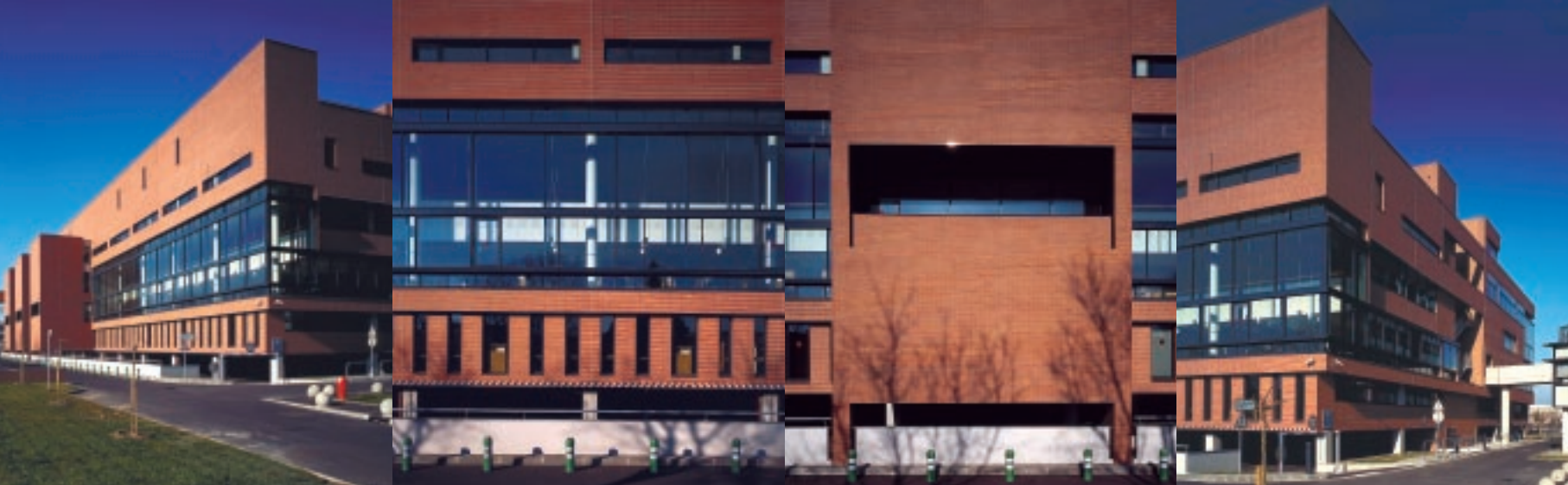
In alto: fronte sud (generale e dettaglio) e angolo sud-est. In basso: la facciata settentrionale.